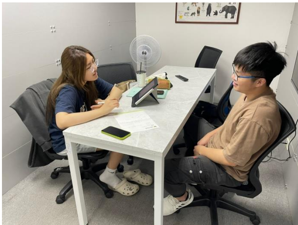
進行一對一口語小老師練習