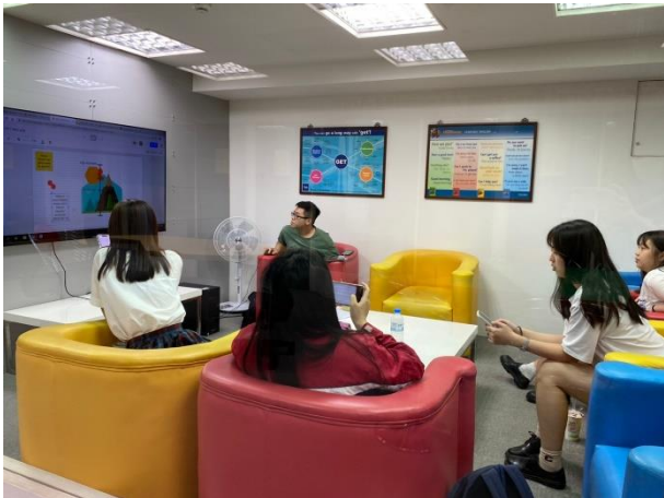
進行小團體口語練習