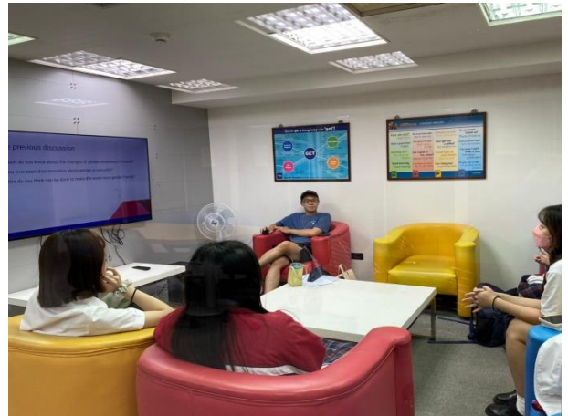
進行小團體口語練習