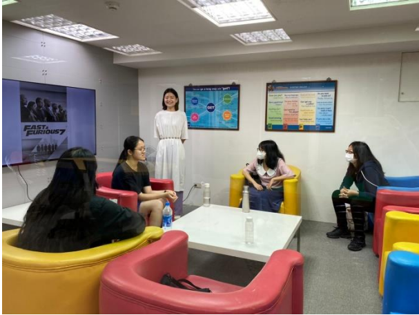
進行小團體口語練習