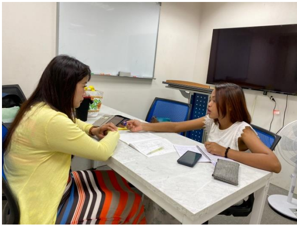
進行一對一口語小老師練習