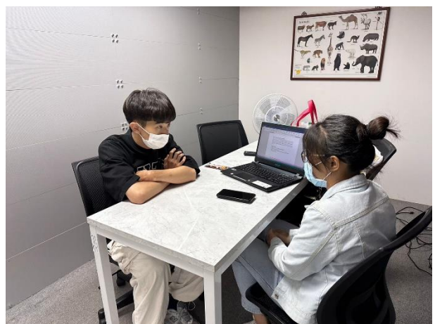
進行一對一口語小老師練習