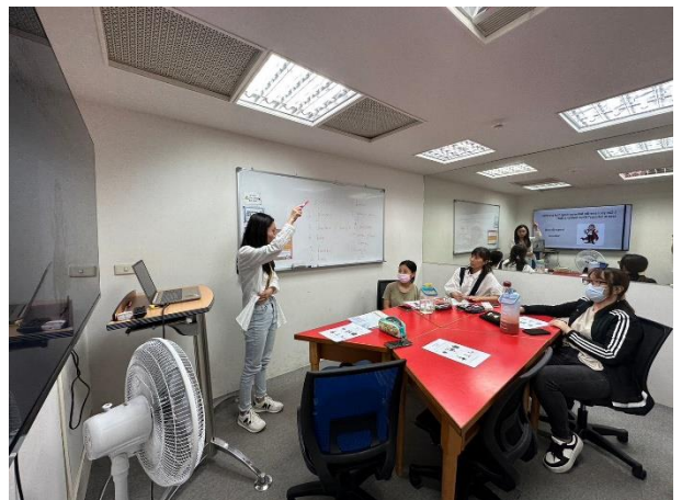
進行小團體口語練習