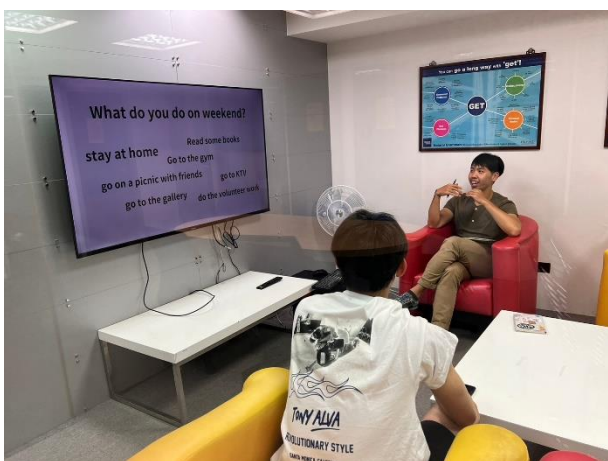
進行一對一口語小老師練習