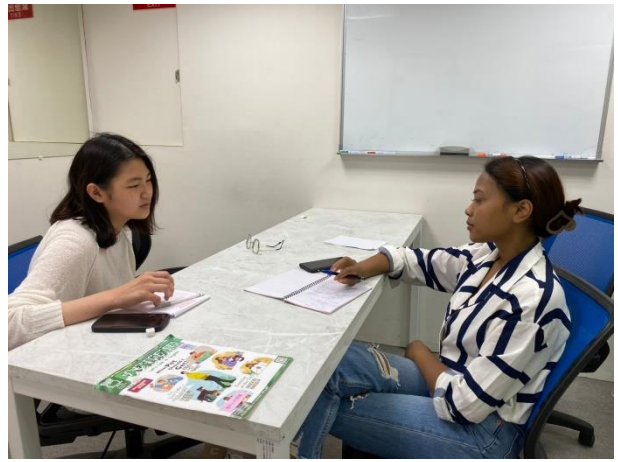
進行一對一口語小老師練習