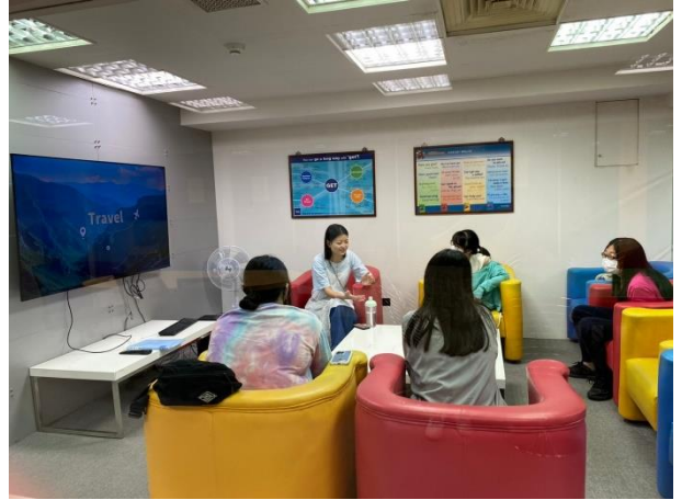
進行小團體口語練習