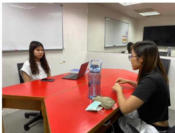
進行一對一口語小老師練習