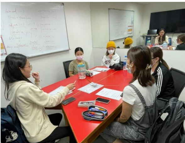
進行小團體口語練習