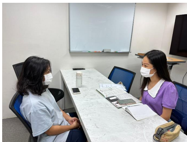
進行一對一口語小老師練習