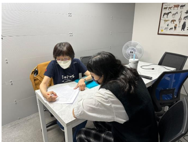
進行一對一口語小老師練習