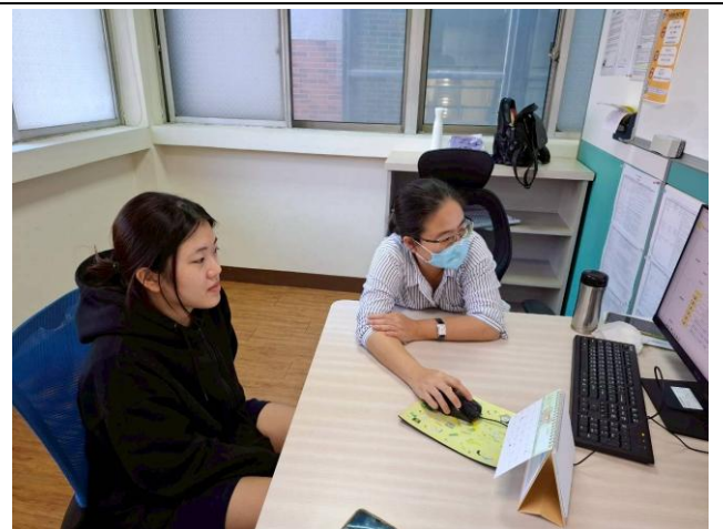
語言諮商診斷 活動花絮