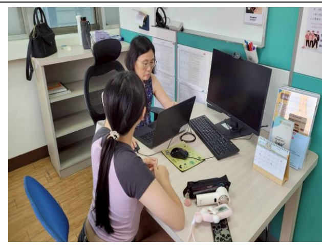
語言諮商診斷 活動花絮