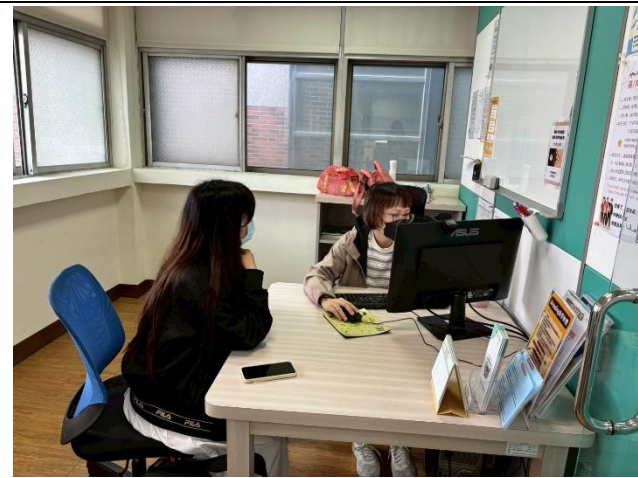
語言諮商診斷 活動花絮