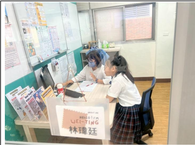
語言諮商診斷 活動花絮