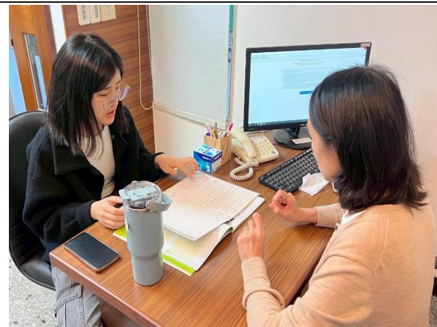
語言諮商診斷 活動花絮