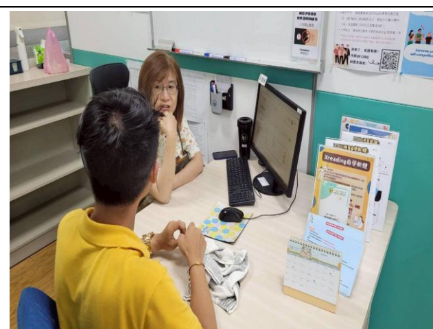
語言諮商診斷 活動花絮