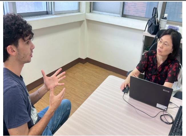
語言諮商診斷 活動花絮