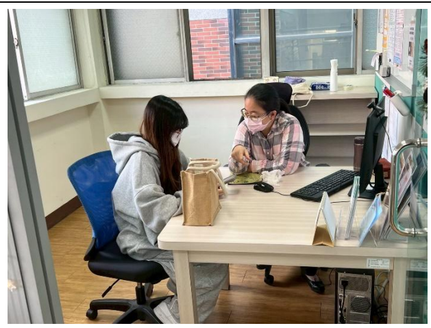
語言諮商診斷 活動花絮