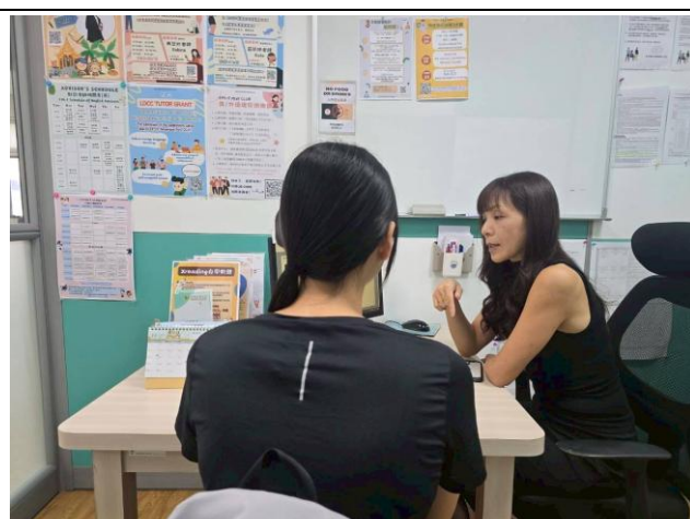
語言諮商診斷 活動花絮