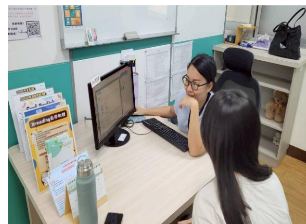
語言諮商診斷 活動花絮