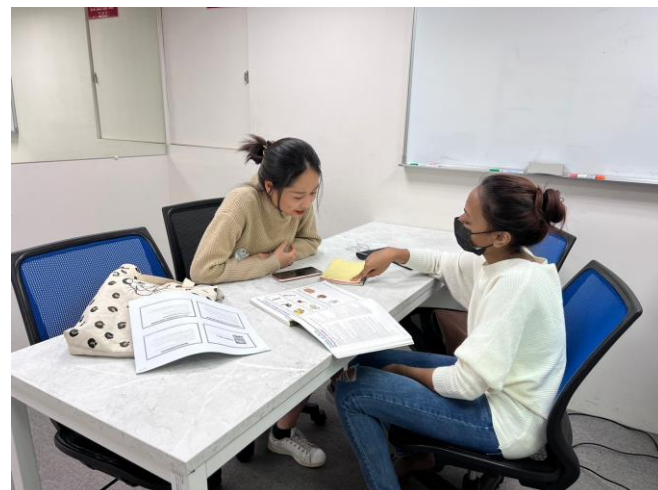
圖(四) 進行一對一口語小老師練習