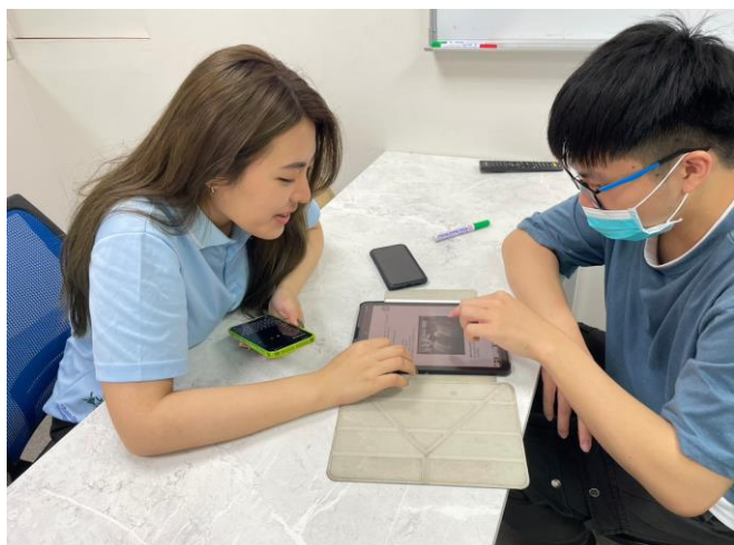
圖(三) 進行一對一口語小老師練習