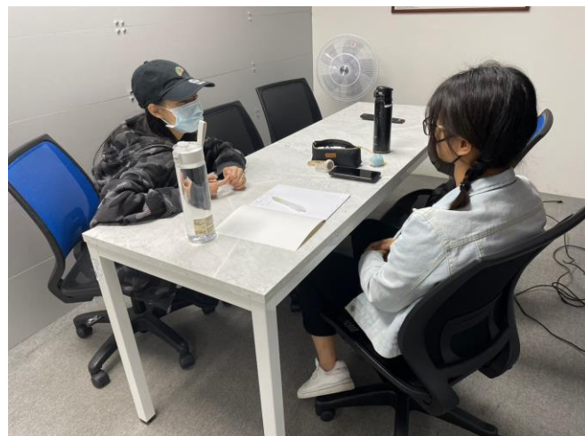
圖(二) 進行一對一口語小老師練習